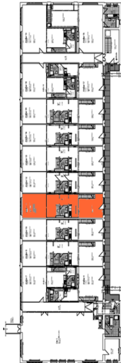
Geschossplan: Obergeschoss mit Lage des Ateliers