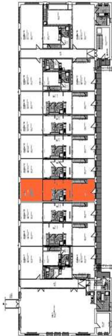
Geschossplan: Obergeschoss mit Lage des Ateliers