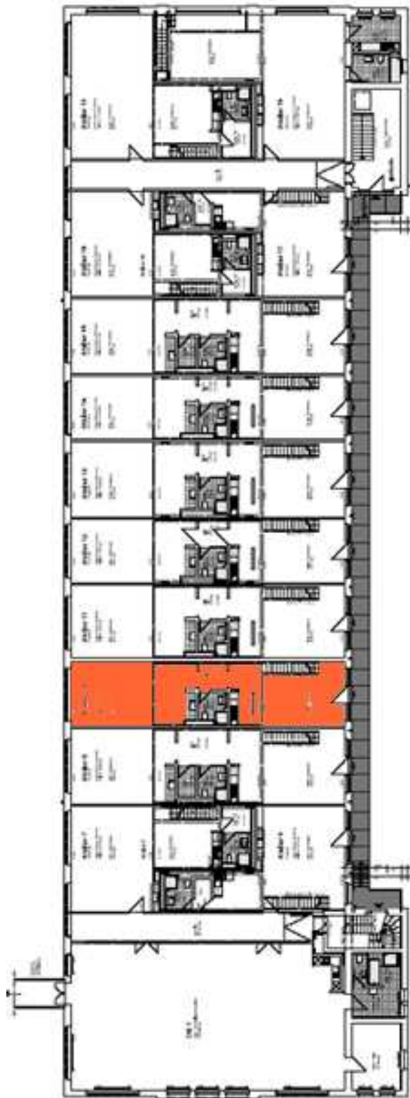
Geschossplan: Obergeschoss mit Lage des Ateliers